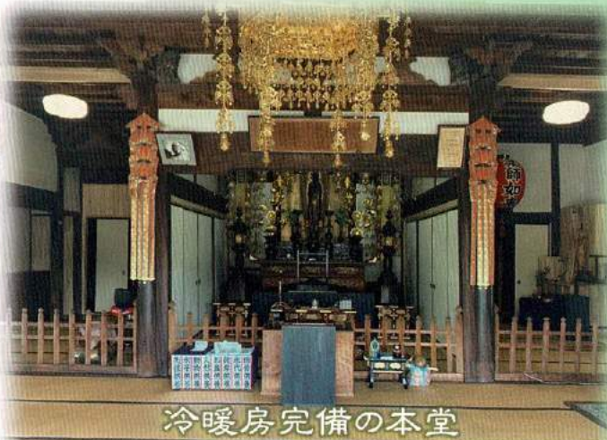
冷暖房完備の本堂

お寺とは、『仏様が居られる心安らぐところ』 気負いなく一度お参りに来て見て下さいませ。