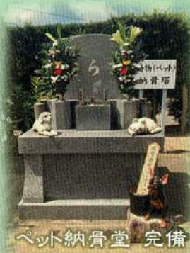
ペット納骨堂 完備