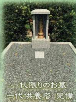
一代限りのお墓 一代供養塔 完備